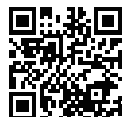
ホームページQRコード