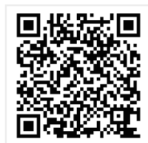
Zoom 用 QR コード

勉強会の開始15分位前までに以下の要領で、Zoomアプリをインストールください。